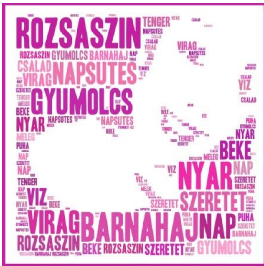
2. kép Önarckép – képvasként

Miért jobb ez, mint a papír és a ceruza? Miért vesszük el az offline, valós alkotás örömét? Tudom, hogy sok kolléga idegenkedik a fölösleges eszközhasználattól, és ezzel egyet is értek. De itt most, úgy vélem, sokat tesz hozzá az IKT az élményhez. A szöveghőben ugyanis számtalan variációját tudjuk létrehozni igen gyorsan ugyanannak az önarcképnek. Változtathatunk színt, betűtípust – ezek mind részei lesznek az önarcképnek, azaz ezek a változtatások is mind segítik az önreflexiót. A sárgát válasszam, vagy a feketét? Ez is önmeghatározás. Ráadásul a diák kivehet vagy betoldhat még szavakat – ezek is újragondoltatják az önarcképet, tehát az önmeghatározást is. Hiányzik tehát a valós, fizikai alkotás, de maga az alkotási folyamat megsokszorozódik. Talán könnyelművé teszi az alkotót a virtuális tér, hiszen nem olyan súlyos a döntése – ugyanakkor dönthet többféleképpen is, és akár egy Andy Warhol-stílusú sorozattal is kifejezheti önmagát, megalkothatja megsokszorozódott önarcképét.