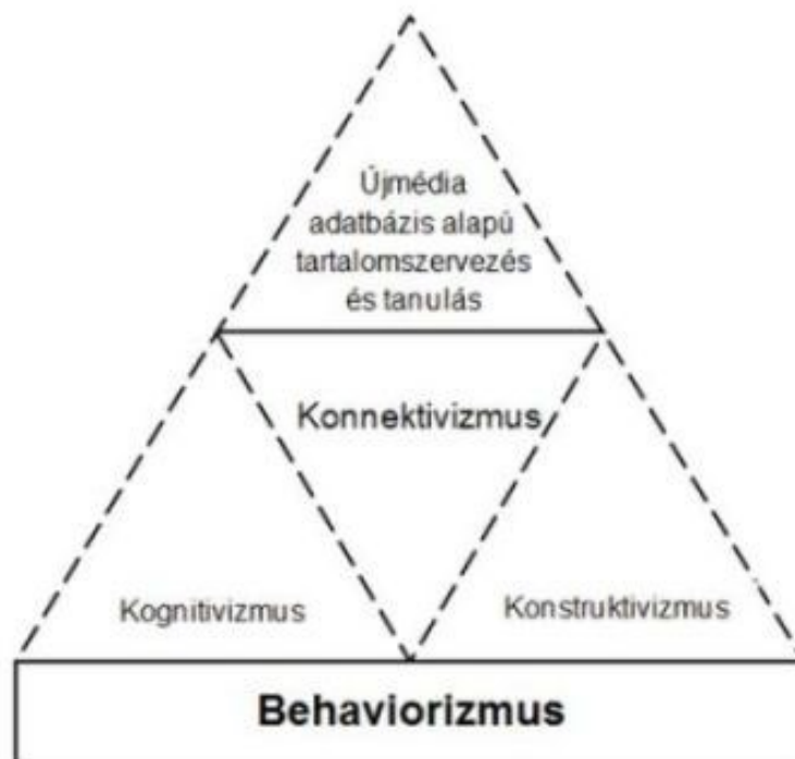
1. ábra Tanuláselmélet és az újmédiarendszer kapcsolata (1)

A felhasználók fogalma alatt a tanulókat és a pedagógusokat, mint civil tartalomszervezőket, egyaránt érthetjük (Forgó 2013), ebből adódóan a szakirodalomban megjelent az újmédia és az oktatás kapcsolatának tanulmányozása is. Az alábbi ábra a különböző tanuláselméletek és az újmédia kapcsolatát mutatja be. Arra is rávilágít, hogy az újmédia közösségi lehetőségei már a konnektivistá tanuláselmélet egymástól való, szociális tanuláselméletében is megjelentek.